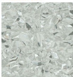
Polyflor Finesse SD lodestone 5830

Kui mingis osas nõuded põrandatele puuduvad juhinduda Sisetööde RYL 2013/2021 nõuetest. Samuti tuleb tööde teostamisel järgida materjali või toote tootja-tarnija paigaldus- ja hooldusjuhiseid.